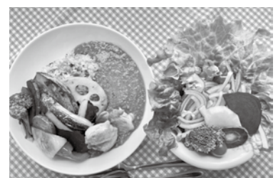
ゴロゴロ野菜とひき肉の菜七彩 カレースマートミールセット