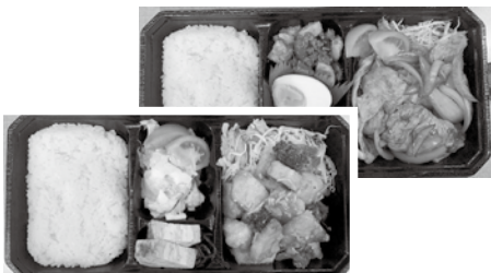
(上)チキンの生姜焼き弁当 (下)めかじきのねぎソース和え弁当