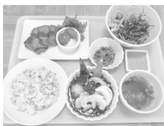
つちのかスペシャルスマート ミール