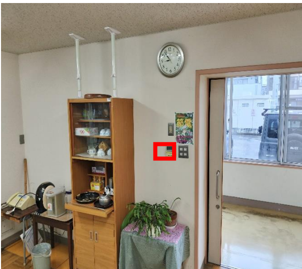
リモコン設置場所