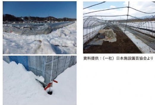
資料提供：（一社）日本施設園芸協会より

https://www.pref.tochigi.lg.jp/g04/kisyousaigai/ametaisaku.html