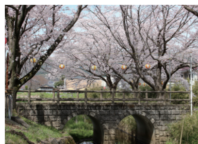
宮前橋(めがね橋) 📍利保町名草川沿い