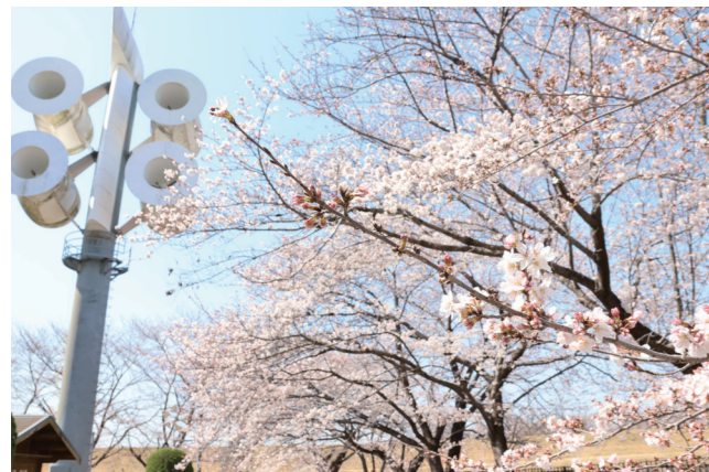
風と光の広場 大学敷地内にある広場