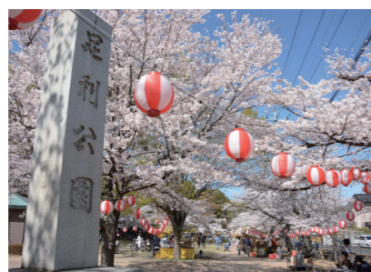
足利公園 📍緑町一丁目3775-1 外