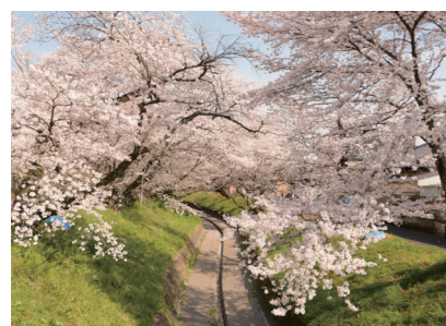
千歳町の袋川 📍千歳町袋川沿い