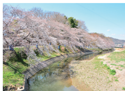
助戸新山公園 📍助戸新山町1564-1