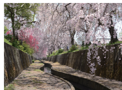
旧袋川のしだれ桜 📍東砂原後町 旧袋川沿い