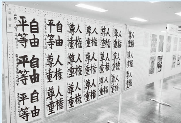
以前の作品展示(ギャラリー)の様子

この「人権フェスタあしかが」では、人権に関する書道・ポスター・作文コンクールの入賞作品の表彰に加え、今年は、男女共同参画のキャッチフレーズに関する表彰式を実施するほか、入賞作品の展示などを実施します。