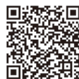
催しの詳細はこちら

そのほか、当日は、足利ユースオーケストラによる演奏や、人権擁護委員による人権相談の開設、また、作品展示会場で人権擁護機関の紹介などを実施します。詳細は、チラシや足利市のホームページ(二次元コード)をご覧ください。皆様のお越しをお待ちしています。