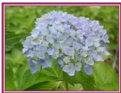
スポーツ広場の【あじさい】