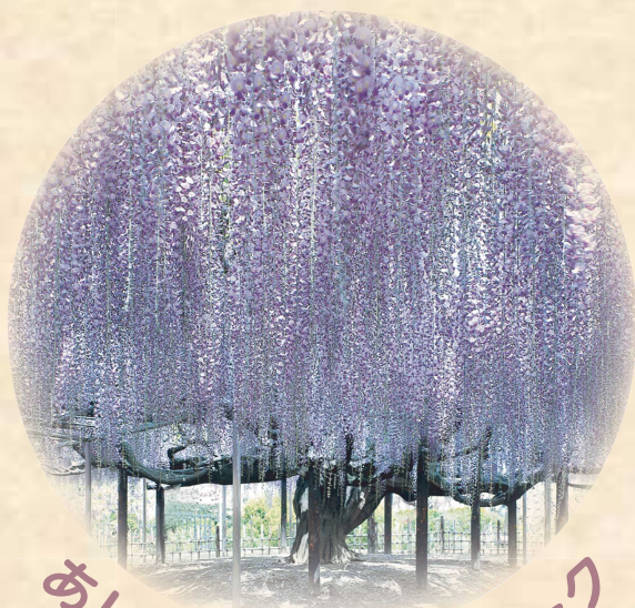
あしかがフラワーパーク