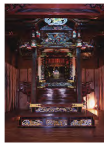
星宮神社 本殿 (梁田町)