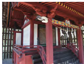
春日神社 本殿 (小俣町)