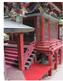
樺崎八幡宮 本殿 (樺崎町)