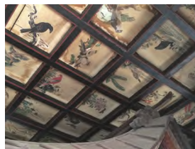
日光鹿島神社 天井板絵 (大久保町)