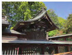
下野國一社八幡宮 本殿など(八幡町)