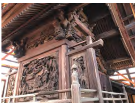
赤城神社 本殿 (上渋垂町)