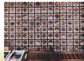
三柱神社 拜殿天井板絵 (駒場町)