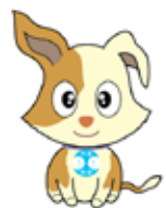
行政相談 マスコット 『キクーン』