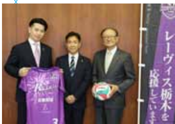
▲(株)Reve'sの店網代表取締役(左)と県バレーボール協会のおおまめうだ大豆生田会長(右)

市民の皆さまには、地元ของทีมとして温かく見守っていただき、いろいろな形で応援ご支援をよろしく願います。