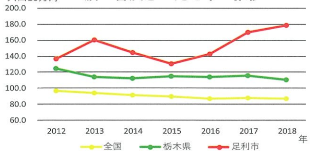
人口10万対 脳血管疾患の死亡率の推移