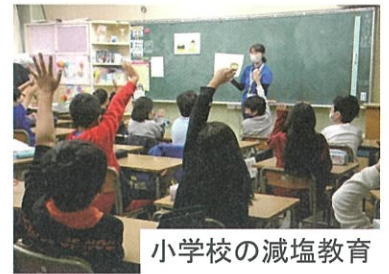
小学校の減塩教育

足利市は、市民の塩分摂取が多い、若い世代に運動習慣を持つ人が少ないことなどから、高血圧ゼロのまちづくりを進めています。