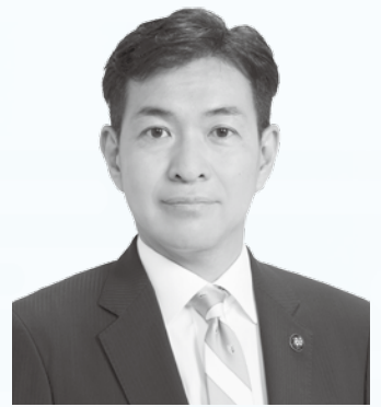
インターチェンジ

足利スマートICの開設、新産業団地の造成などの大型プロジェクトも進めていきます。市民会館や市役所などの大型公共施設の建て替え議論を含め、先送りせずスピード感を持って取り組みます。