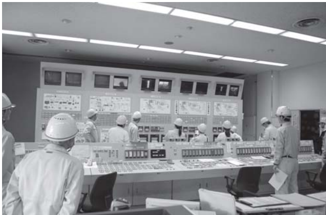
▲4月27日 民生環境水道常任委員会視察 南部クリーンセンター

本市の主要事業等についての現状を把握し、さらに認識を深めた政策提言につなげるため、現地視察を行いました。