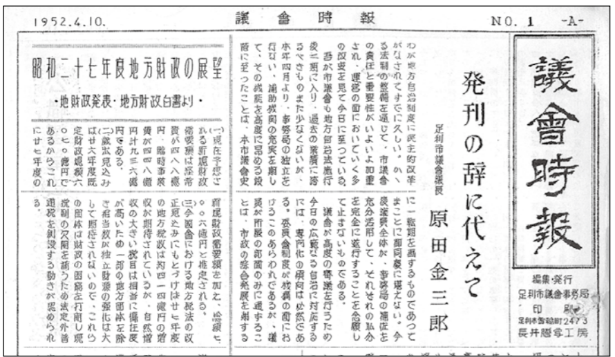
1952年4月10日に議会時報という名称で発刊