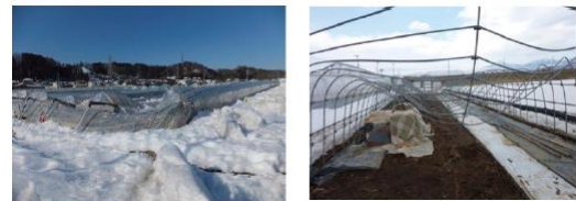
資料提供：（一社）日本施設園芸協会より

https://www.pref.tochigi.lg.jp/g04/kisyousaigai/ametaisaku.html