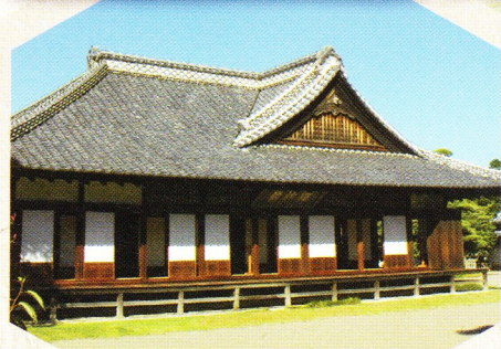
弘道館の正庁(水戸市)

来日外国人 が驚くほどの高水準に あった近世日本の教育。日本の知 的・文化的発展の基盤となりました。 世界遺産条約採択40周年を記念し、 本シンポジウムでは、茨城県水戸市、 栃木県足利市、大分県日田市が共同で 調査・研究を進める「近世日本の教育 遺産」というテーマについて、国際的な 視野から、その価値や意義 を考えます。