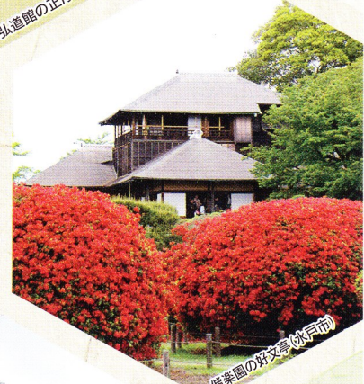
偕楽園の好文亭(日田市)