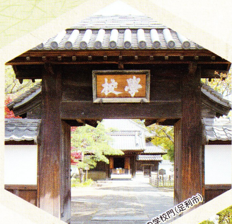
足利学校の学校門(足利市)