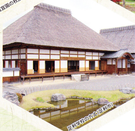
足利学校の方丈(足利市)