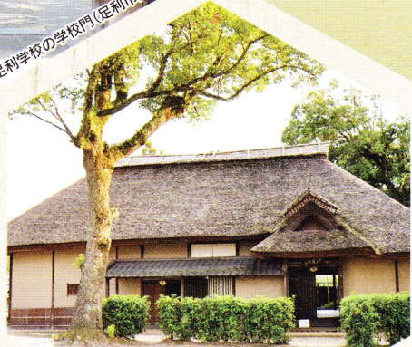
偕楽園の秋風庵(日田市)

来日外国人 が驚くほどの高水準に あった近世日本の教育。日本の知 的・文化的発展の基盤となりました。 世界遺産条約採択40周年を記念し、 本シンポジウムでは、茨城県水戸市、 栃木県足利市、大分県日田市が共同で 調査・研究を進める「近世日本の教育 遺産」というテーマについて、国際的な 視野から、その価値や意義 を考えます。