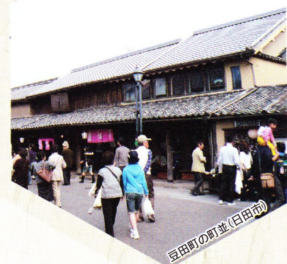
豆田町の町並(日田市)