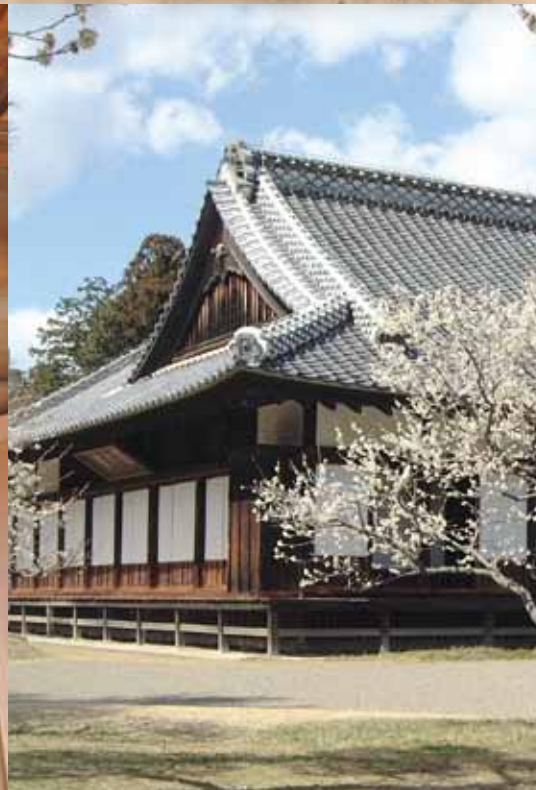
弘道館正庁 (茨城県水戸市)

教育は、国や民族、そして時代をも越える 人類普遍の文化的活動です。 国内に現存する教育遺産を通じ、 「教育爆発の時代」と言われた 近世日本の教育の特色を見直してみませんか？