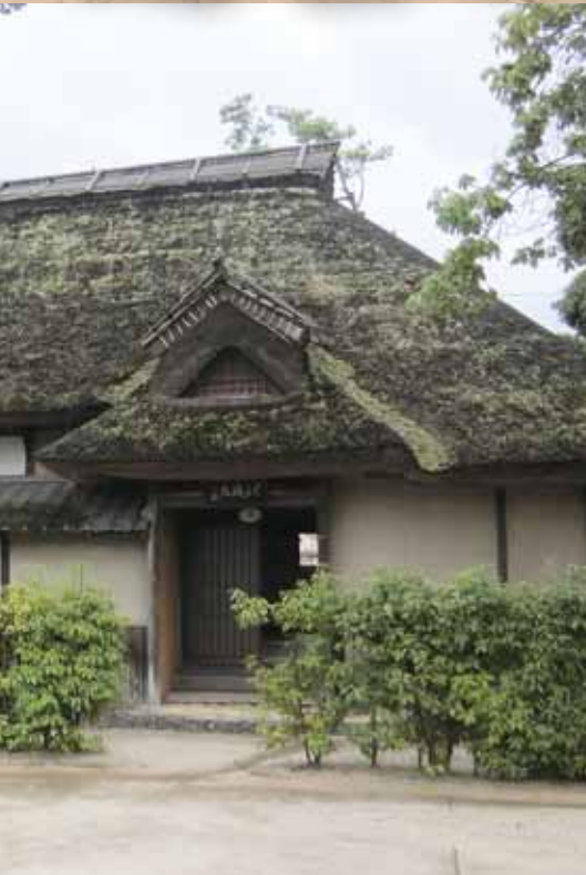
咸宜園秋風庵 (大分県日田市)