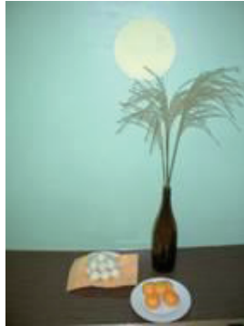
じゅうごや 十五夜