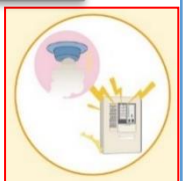
自動火災報知設備