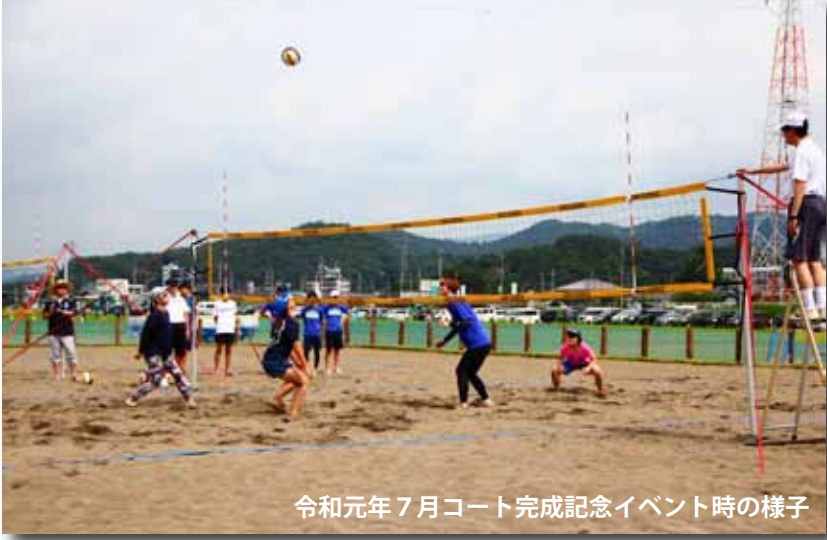
令和元年7月コート完成記念イベント時の様子

※観戦は無料ですが、新型コロナウイルス感染症感染対策の観点から入場制限もしくは無観客で実施する場合があります。