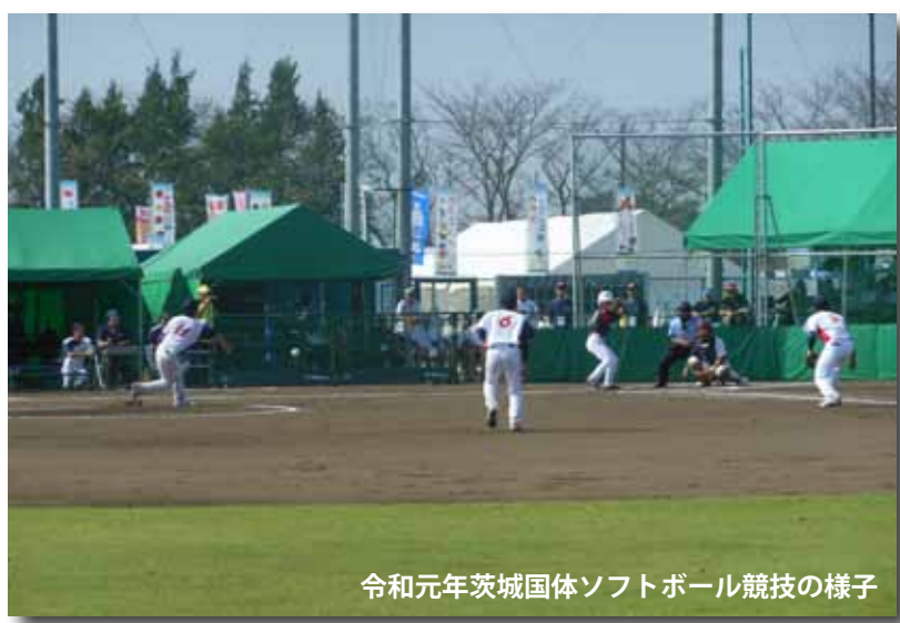
令和元年茨城国体ソフトボール競技の様子