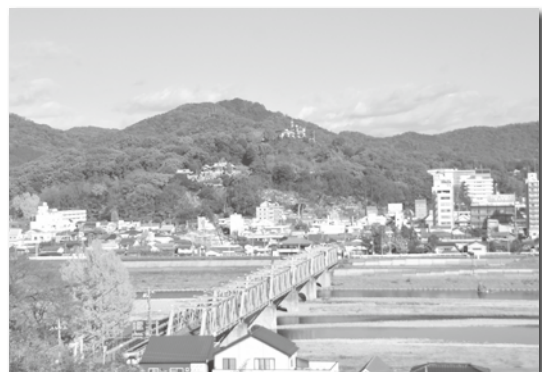
▲令和元年。左の写真と同様の場所で撮影