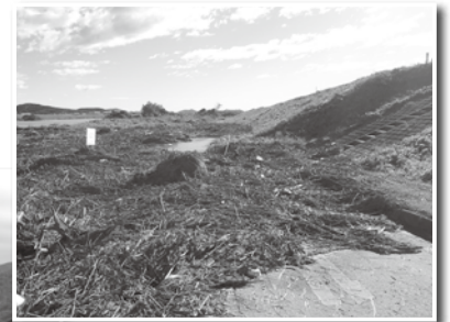
渡良瀬川河川敷内梁田緑地