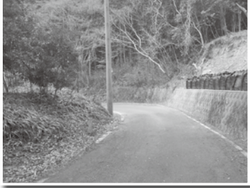
大岩町地内 ▶被災時 ▼復旧後