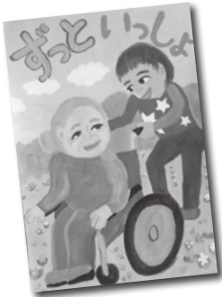
▲高山莉穂さんの作品