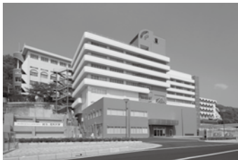
足利大学本城キャンパス本館(本城三丁目) マスドライフ足利(本城三丁目)