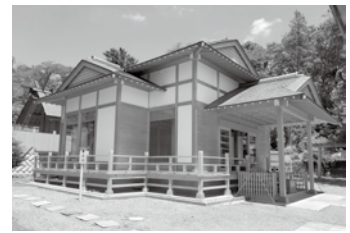
八雲神社(緑町一丁目)