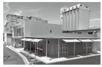
笠原産業株式会社(福居町)