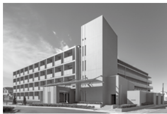
足利赤十字病院 職員寮(五十部町)