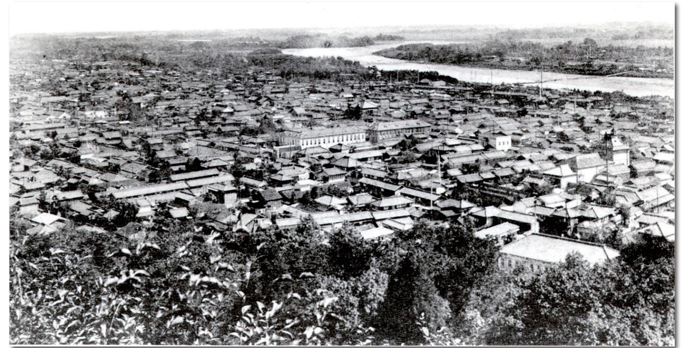
▲昭和初期の頃の市街地。