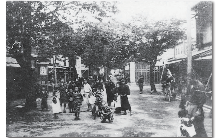
▲大正12年・御厨町役場新築記念時の福居足利通り。