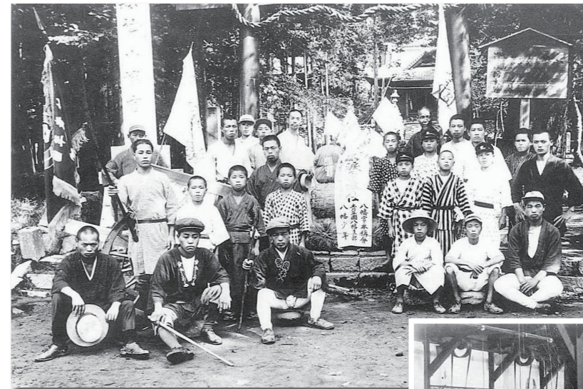
◀大正12年の関東大震災による被災地・東京方面へ、食糧物資の運搬などによる救援活動が行われた。