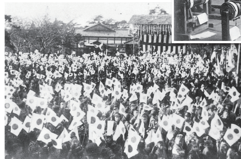
◀市制施行祝賀に参加した学生の旗行列。