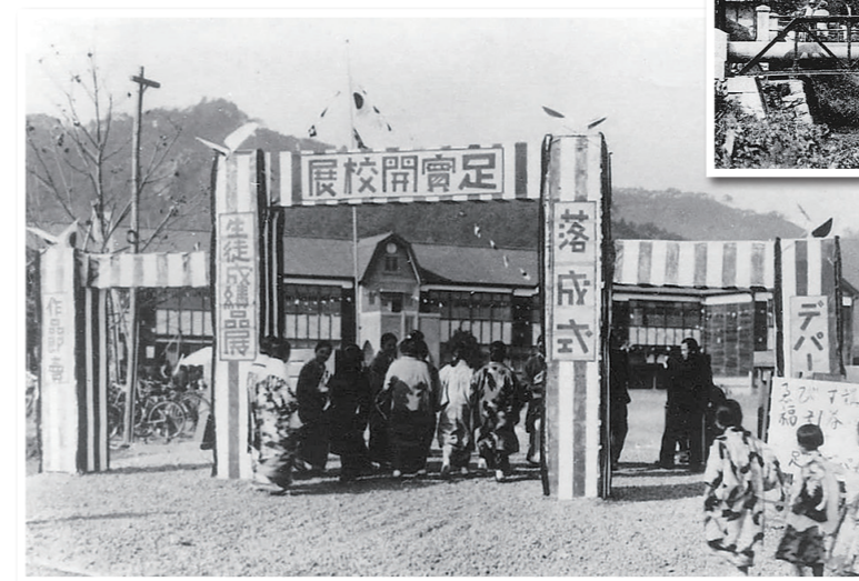
◀昭和9年4月・足利市実業学校の開校展。