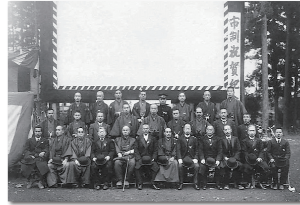
▲大正10年・市制施行時の記念写真。