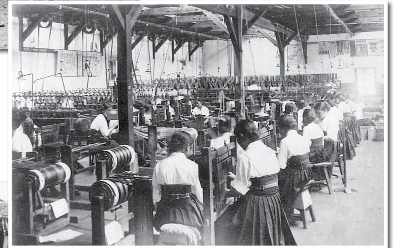
▶大正13年ごろの織物工場。