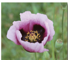
◀花びらは4枚で薄紫色、葉の付け根は茎を巻き込むような形