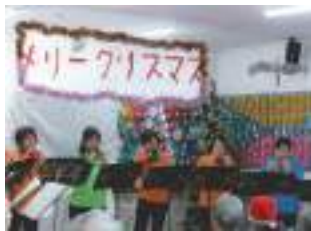
講座「楽しくオカリナを吹こう」

楽習講師が自ら企画・運営する講座です。様々なジャンルが開催され、初心者の方でも気軽に参加できるので生涯学習のきっかけづくりに最適です。