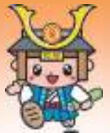
足利市イメージキャラクター 『たかうじ君』