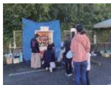
各地区推進委員の活動