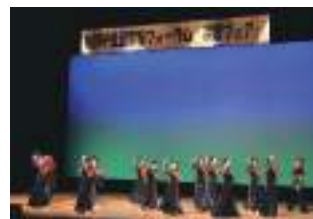
楽習講師による「楽習フェア」の様子