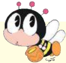
生涯学習のマスコット 「マナビィ」

足利市、佐野市、桐生市、太田市、館林市、みどり市の6市で構成され、両毛地域という日常生活圏内での広域学習ネットワークの構築に向けて結成したものです。 事業・情報・施設など、様々なネットワーク化について検討、研究、実践をしています。