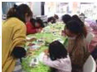
アイシングクッキー教室