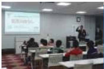
危機管理課による防災講座