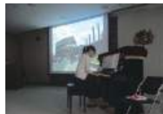
お話とピアノで巡る地中海講座