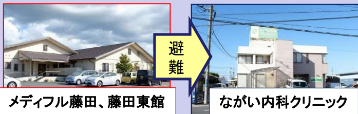
※両施設とも、医療法人よつば会が運営