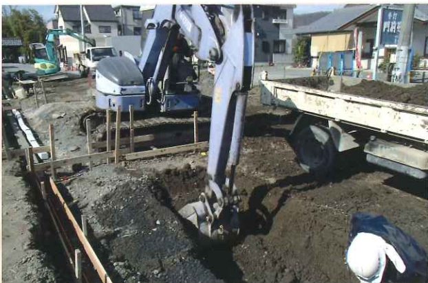
区画道路5号線築造工事