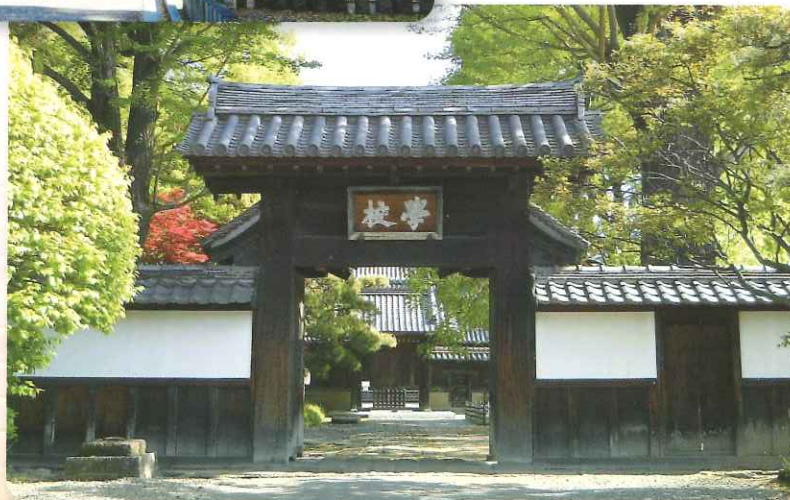
史跡足利学校 平成27年4月 日本遺産認定