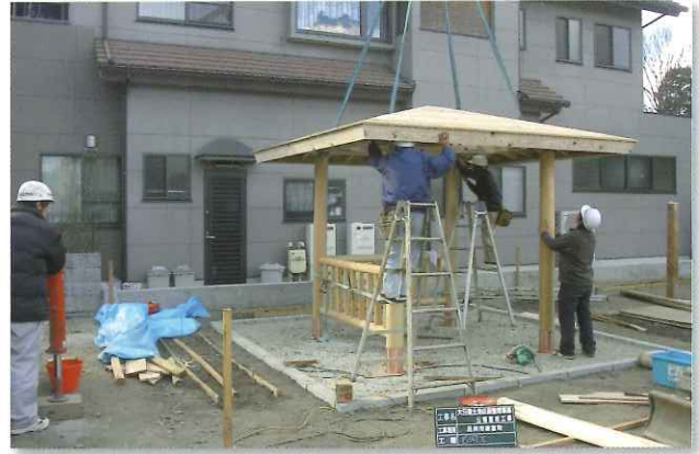
地区内公園造成工事