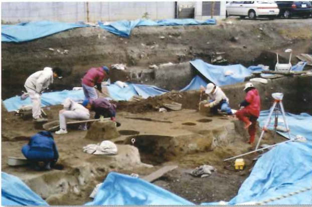
埋蔵文化財発掘調査