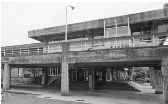
▲足利市民会館(会館棟)