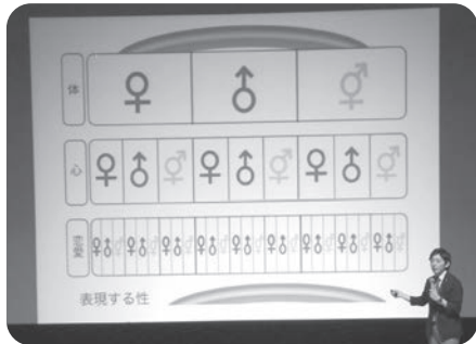
→人権問題講演会でLGBTをテーマとして講演を行いました

電通ダイバーシティラボが2018年に全国の20〜59歳の約60,000名を対象として行った「LGBT調査2018」によるとLGBTに該当するとした人は8.9%でした。8.9%という数字は11人に1人の計算です。誰にもカミングアウトできずに、悩んでいる人が身近にいるかもしれません。性別は、「身体性」「心の性」「好きになる性」の組み合わせにより、グラデーションのように1人1人異なっています。多様な性について正しく知り、誰もが自分らしくいることが尊重される社会にしていきたいませんか。