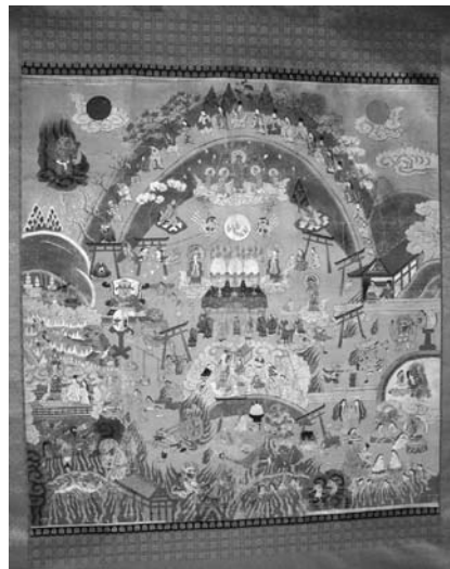
絹本着色 熊野欽心十界図 江戸時代 小俣地区 長福院所蔵