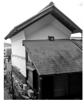
文久2年建築の土蔵(月谷町)