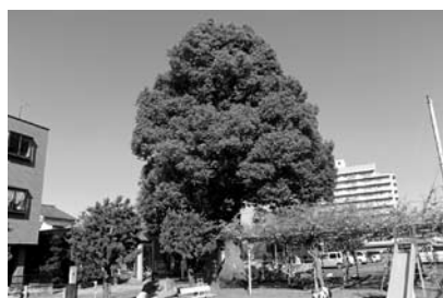
母衣輪神社のクスノキ