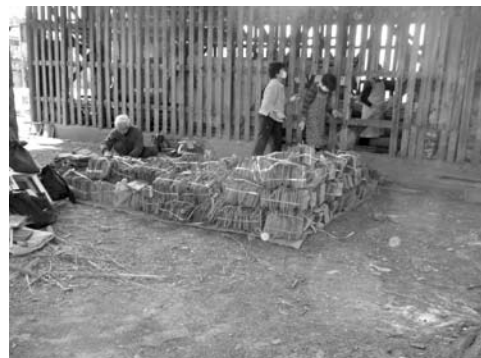
絵馬の調査状況(八坂神社)