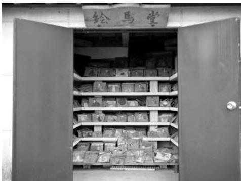
絵馬の保管庫(水使神社絵馬堂)