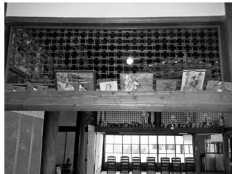
絵馬の奉納方法の例