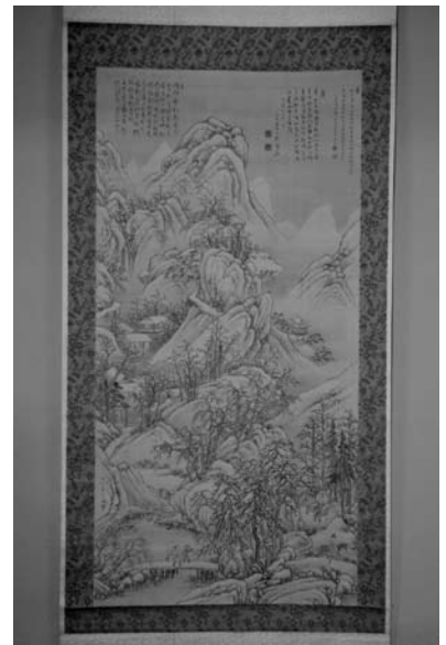
絹本墨画、淡彩 雪見行旅図(高久露厓 筆) 旧市内地区 宝禅寺所蔵