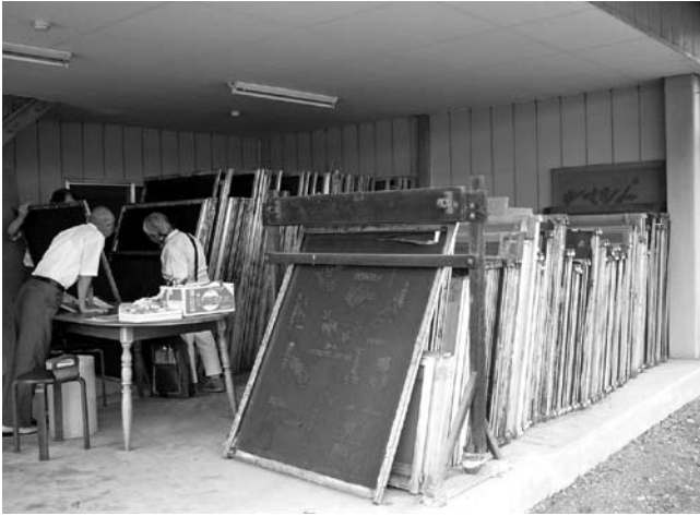
スクリーン収納庫