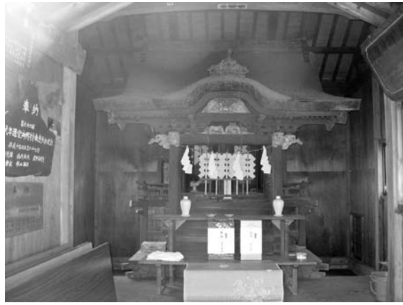
柿本大明神(野田町)