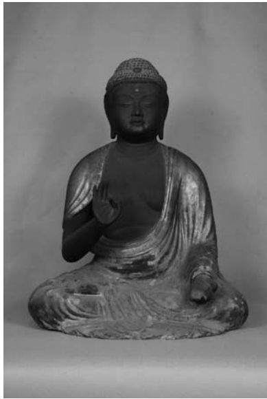
木像 阿弥陀如来坐像 平安時代 旧市内地区 徳正寺所蔵