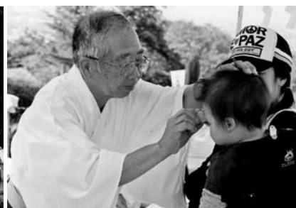
浅間山ペタンコ祭