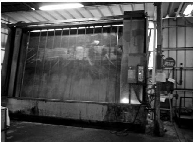
スクリーン洗浄機