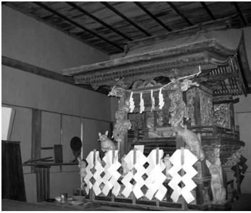
稲荷神社本殿(藤本町)