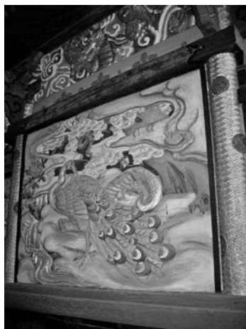
稲荷神社本殿の彫刻(菅田町)