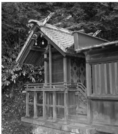
水使神社本殿(五十部町)

悉皆調査の結果、16世紀にさかのぼる可能性のある神社や江戸後期の彫刻が施された神社等が確認され、今後さらに建造物の詳細調査を実施する必要がある。