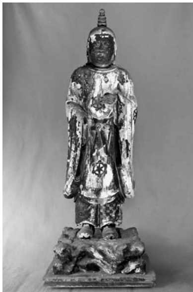
木造 雨宝童子立像 室町時代 毛野地区 永瀬不動堂所蔵