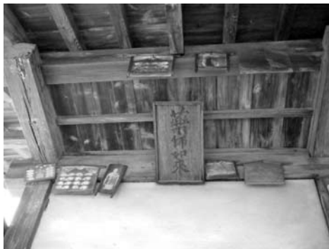
絵馬の奉納方法の例

小絵馬の宿命として風雨に耐えながらやがて朽ち果てて行くことが運命と思われるが、そのような状況の中で島田町の八坂神社の小絵馬調査を実施し、3万枚を超える絵馬を確認したものの、11月の不審火によりほぼ全て焼失してしまった。火災等から文化財を守ってゆくことは、所有している各社寺の方々としても大変なことであると思われるが、貴重な文化財を守るための何らかの工夫が早急に望まれている現状だと痛感した。