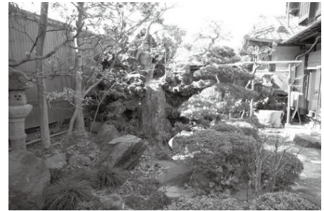
初代植彦による庭園(みやこ旅館庭園)

第2次調査では庭園の略測を行い、建物の配置、庭園の形状、主要な庭石・植栽・景物（手水鉢や灯籠）の規格あるいは特徴を書き入れた。詳細な分析は今後の課題であるが、庭石など作庭素材は渡良瀬川流域や名草といった足利市内から調達されたもののほか、三波川流域や桐生からの搬入があったようである。特に好まれた石材としては、桐生で産出される「梅田石」や「サラサ」と呼ばれる景石がある。