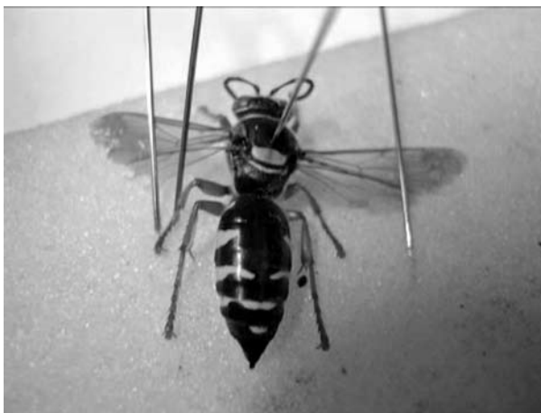
キアシハナダカバチモドキ

今後、昆虫という天然記念物を通して足利市を考えるためには、どんな虫がいるのかできる限り詳しい目録が必要であり、標本や記録を残しておくことが不可欠である。そして、それらを誰もが利用できる公共の博物館に保管しておかなければならない。