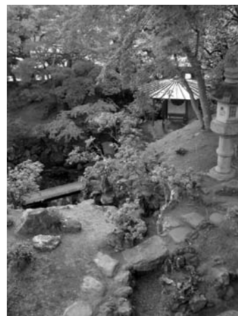
住宅庭園(新藤家庭園)

次に、江戸時代にさかのぼる事例が寺院・住宅にいくつか存在していることである。名草地区の臥龍院庭園、北郷地区の隆興寺庭園、旧市内地区の法楽寺庭園等である。