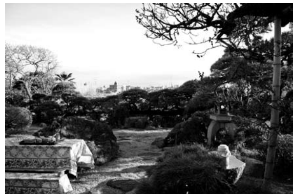
別荘庭園(古梅山荘庭園)