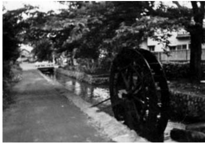
葉鹿大前用水に水車が回る せせらぎの原風景