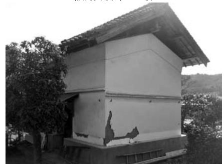
享保20年建築の土蔵(名草下町)