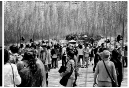
あしががフラワーパーク