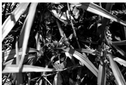
菅田稲荷神社の社叢に 生育するキチジョウソウ