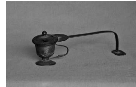
柄香炉 慶安2年(1649) 北郷地区 浄因寺所蔵