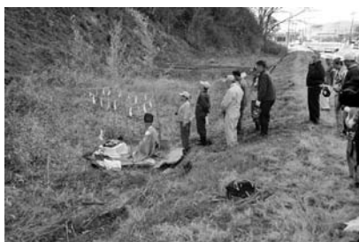
ミツバツツジ自生地の 下草管理前の神事の様子