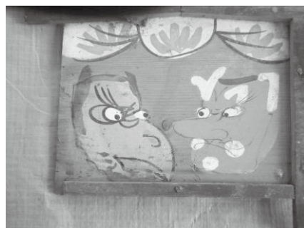
向い天狗図(八坂神社)

い天狗図」の絵馬を神社より授与され、門口に護符として貼り付けて魔除けや災難除けにし、1年間経過後に神社に返納すると、また新しい小絵馬を授与されるという習俗があった。神社に返納された大量の小絵馬が絵馬庫に保管され、今日まで引き継がれてきたが、残念ながら平成21年11月20日の不審火により全焼してしまった。西部地区では大手神社15,662枚、水使神社3,464枚、浄林寺に223枚、大原神社に336枚が確認された。これほど大量の小絵馬がこの地区に残されている背景としては、機業地として機織工女が多く働いていたためと考えられる。工女たちの労働は過酷なものであったといわれ、「もの日」と呼ばれる数少ない休日に、仕事仲間と連れだって娯楽を兼ねて社寺にお参りし、健康や機織技術の上達を祈願し、小絵馬を納める風習があったと思われる。