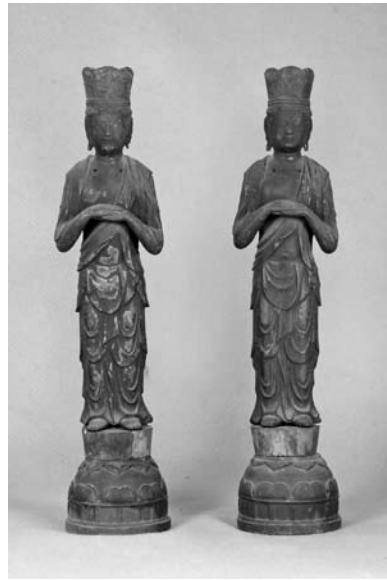
銅造 阿弥陀三尊(両脇侍) 鎌倉時代 三和地区 善光寺所蔵