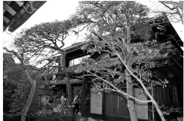
公開例: 松村記念館