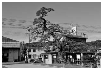
助戸阿弥陀堂の関東九本松