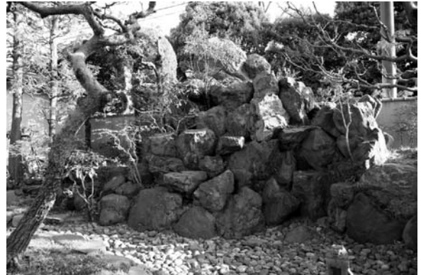
梅田石による築山(吉田家庭園)