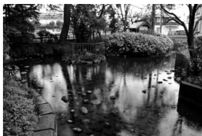
ニホンカワモズク自生地