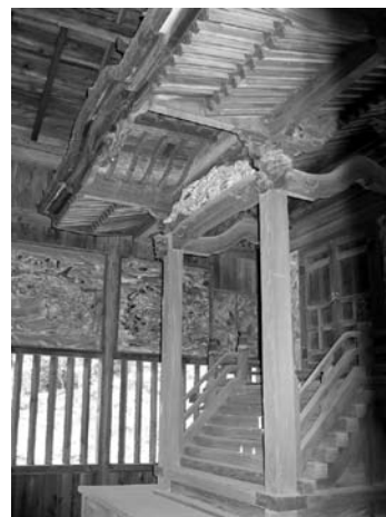
熊野神社本殿(迫間町)