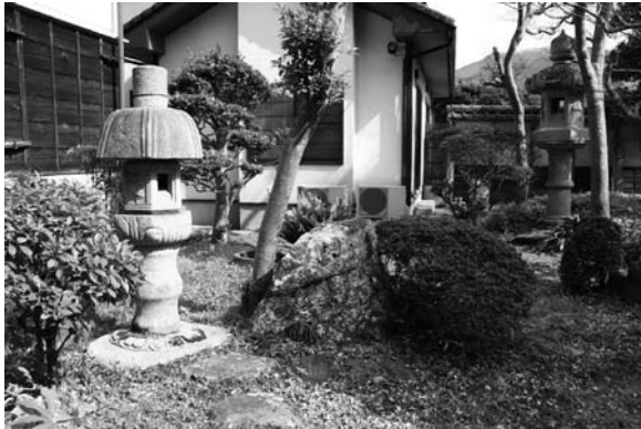
サラサ石(世取山家庭園)