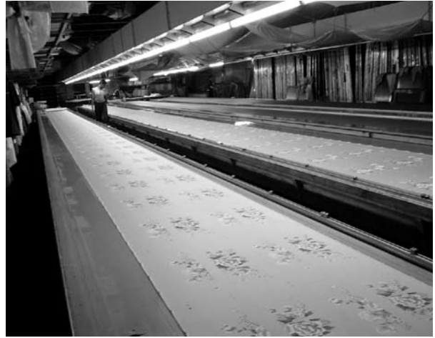
ポリエステル薄地捺染作業(提灯生地)