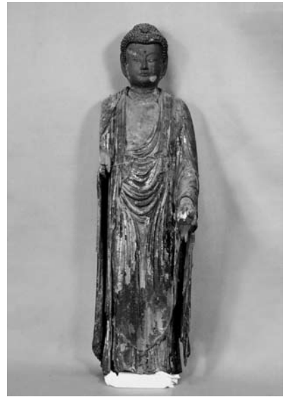
木像 阿弥陀如来立像 鎌倉時代 旧市内地区 常念寺所蔵