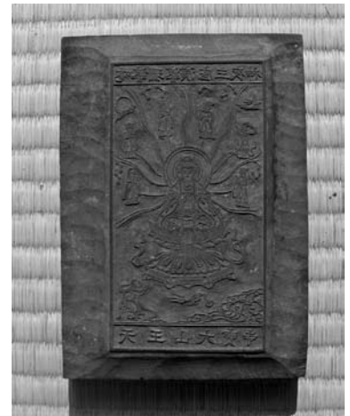
版木 婆珊婆演底主夜神 名草地区 大宝寺所蔵