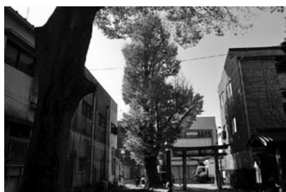
八雲神社のイチヨウ