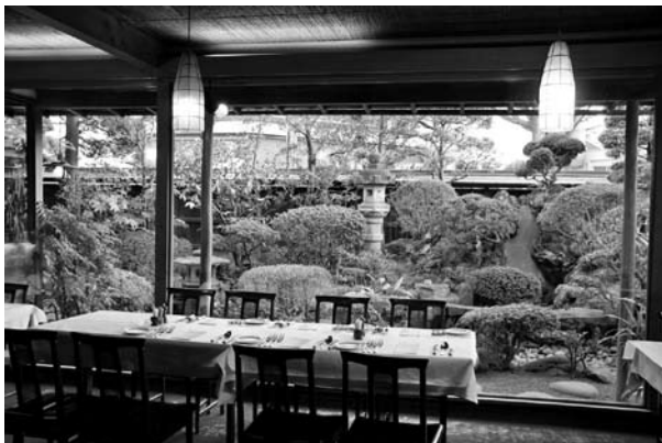
活用例: レストラン(小崎家庭園)

市街地にある庭園は建造物とともに街並みを形作る景観の一つであり、一体的に保存管理計画等を策定することが望まれる。また、新藤家庭園などの特に重要と思われる庭園は詳細調査を実施し、文化財指定、登録を検討する必要がある。