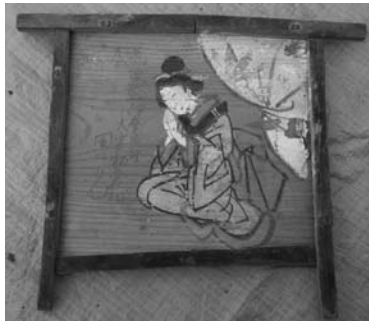
女拝み図(水使神社)