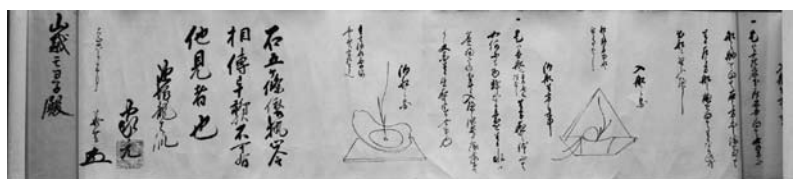
徒然草三箇之大事