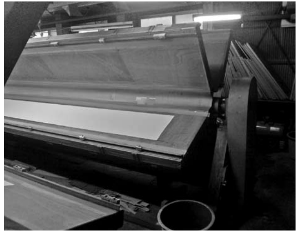
10面の回転式捺染台ボイラー