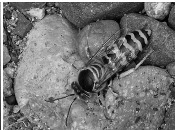
ニッポンハナダカバチ