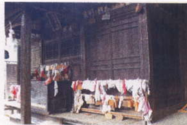
奉納されている下着類

小絵馬の図柄は多種多様で、女拝み、男拝み、家族拝み、男根、男の下半身、両手、八つ目、腰巻、重ね餅、男女背中合せ等足利の小絵馬の図柄のほとんどがここに集まっている。なかでも腰巻図は、全国でも水使さまだけにしか見られない珍品である。また、祈願成就のお礼に、小さな腰巻きを納める風習がある。