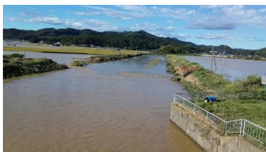
決壊した出流川(寺岡町)