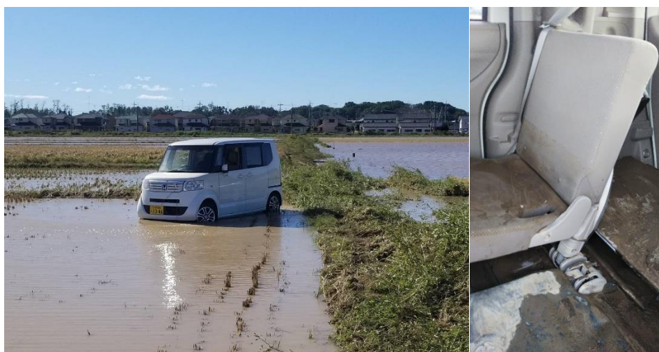
道路から流された軽自動車（寺岡町）

※上記の箇所の外、10月12日夕方から13日にかけて、毛野・富田地区で浸水による道路冠水や通行止め箇所が多数発生した。