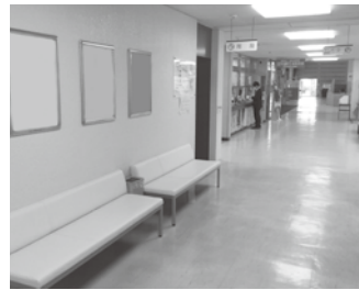
▼1階エレベーターホール