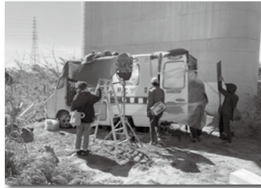
福寿大橋でのロケ

今年度も引き続き多くの作品の支援を行い、皆さまの楽しみの一つにできればと思います！