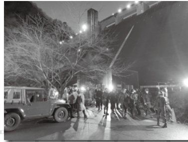
松田ダムでのロケ