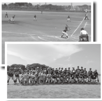
▲鎌倉市学童野球チームとの交流試合の様子

う訪問であること 奨励金額 1人1500円 ※1団体につき年1回まで。予算額を超えた場合は交付できないことがあります。 申込 出発の2カ月前から2週間前までに、必要書類を同課(本庁舎1階) ※申請書は同課または市ホームページで入手可。