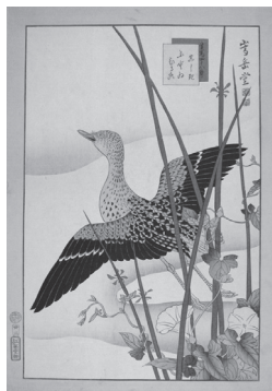
▶生写四十八鷹図 「真しきふとひる顔」

時4月3日(土)～6月13日(日)／午前 9時～午後4時 内草雲が花鳥を 描いた浮世絵『生写四十八鷹図』 と月岡芳年が『うれし相』など女 性の三十二相を表現した浮世 絵を中心に展示 料220円※中学 生以下無料。20人以上の団体は 170円。