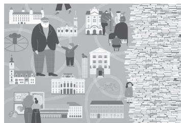
▲スィモナ・チェホヴァー 《魔法の街ブラチスラバ》2018年 (スロバキア)©Simona Čechová

スロバキア共和国で2年ごとに開催されるブラチスラバ世界絵本原画展は、世界最大規模の絵本原画コンクールの一つです。日本巡回展として行われる本展では、チェコとスロバキアの国交100年を記念して、開催国であるスロバキアと隣国チェコの新しい作家に注目し、原画作品のほか、多彩な絵本の数々を展示します。また、日本からの出品作品をご覧いただくとともに、4組の作家に焦点を当て、創作活動の背景を探ります。