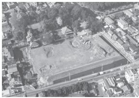
▲昭和61年頃、復原前の足利学校

あれから30年、足利学校は本市のシンボル、市民の学習の場、そして多くの参観者を迎える施設として活用されています。