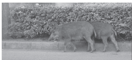
▲エサを与えると、居着いてしまいます。

対象 ①市内または周辺地域に営業所を持ち②指定時間に納品可能であり③衛生管理が徹底された④納品基準を順守できる学校給食用物資取扱業者(精米、パン、牛乳を除く) 指定期間 令和2年4月1日(4年3月31日(2年間)) 納品場所 学校給食調理施設3カ所(今福町、福居町、鹿島町) ※一部の物資は、各学校に納入となる場合があります。 申込方法 12月2日(月)から27日(金)までに次の申請書類を持って同課(教育庁舎2階)