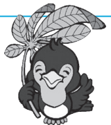
▲県民の日マスコット 『ルリちゃん』