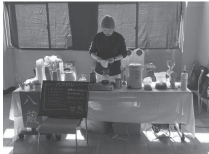
▲おいしいコーヒーがみんなの支えに

今回の作品が公表された際は、同課ホームページなどでお知らせをしますので楽しみに！