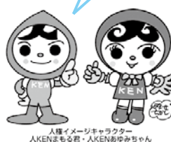
人権イメージキャラクター AKENまもる君・AKENあゆみちゃん