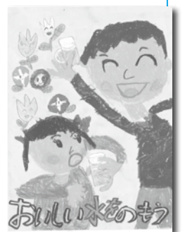
▶茂呂はな乃さんの作品