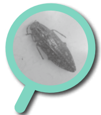
栃木県要注目生物 アオマダラタマムシ (昨年12月)