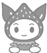
▲献血推進キャラクター けんけつちゃん

《共通》内 16歳から69歳までの健康な方 持 献血カードまたは本人確認できるもの(運転免許証、健康保険証など)