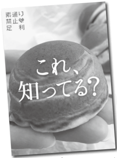
▲ポスターイメージ

街頭インタビューや イベントでのアンケート、 フェイスブックなどで、 たくさんの方から