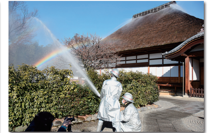
▼令和3年1月・文化財防火デーにともない、史跡足利学校で放水訓練を行った。