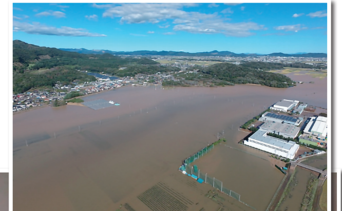
▼令和元年東日本台風の被害の様子。