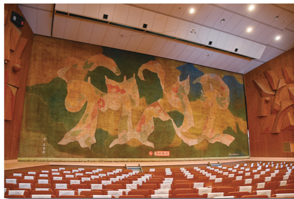
▲市民会館大ホールと緞帳。