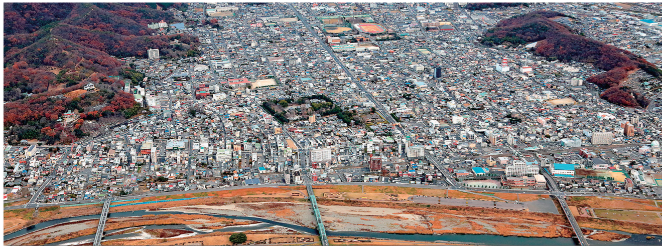
▼令和3年1月・足利の街並みを撮影した航空写真。