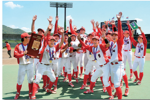
▲令和3年6月・監督を胸上げる全足利の選手たち。