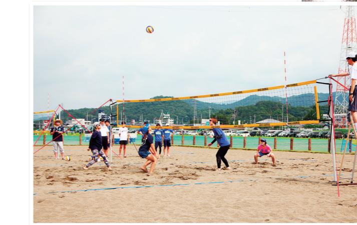
◀令和元年7月・ビーチバレーボールコートの一部が五十部運動公園内に完成した。