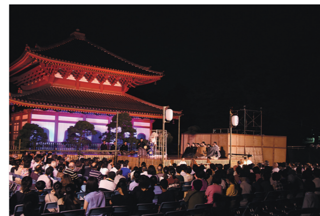
▼令和元年9月・足利薪能、足利薪狂言▼