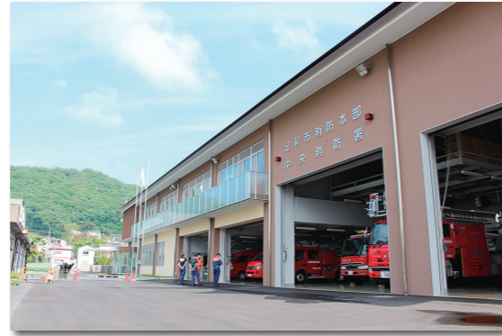
▲令和3年5月撮影・新消防庁舎・中央消防署。