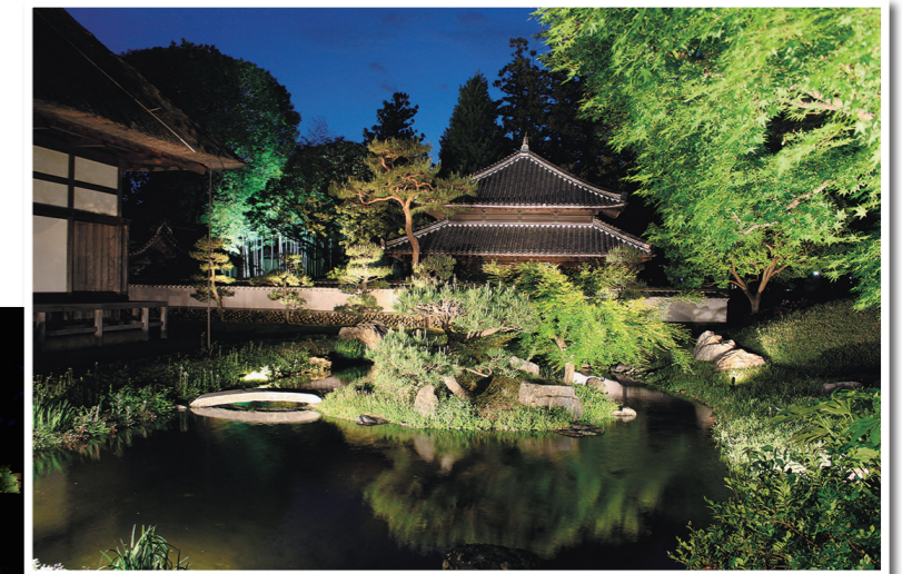
◀▲令和3年4月・足利灯り物語。