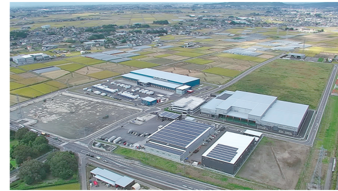
◀令和2年10月撮影・あがた駅南産業団地。