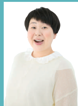
ふたりの未来応援アンバサダー 大島 美幸