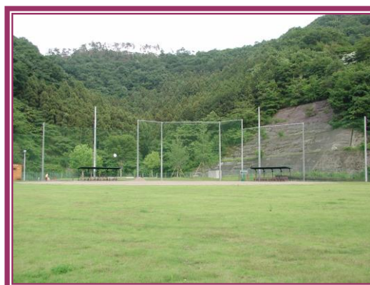
【野 球 場】