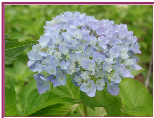
スポーツ広場の【あじさい】