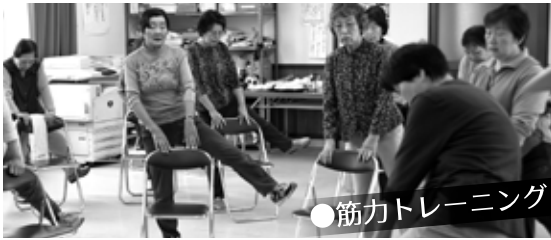
●筋力トレーニング