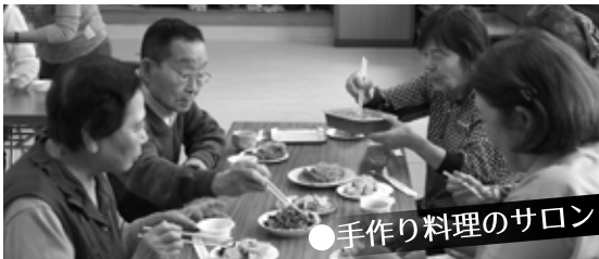
●手作り料理のサロン