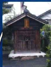
五霊院 (ごんごろ様)