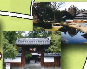
日本遺産 足利学校

日本で最も古い学校として知られ平成27年4月24日史跡足利学校跡を含む「近世日本の教育遺産群—学ぶ心・礼節の本源—」を「日本遺産」に認定。「新刀の祖」と呼ばれ、安土桃山時代に活躍した刀匠「堀川国広」が刀を鍛えたとされる。