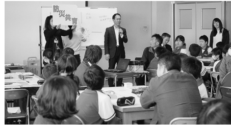
▲防災ワークショップの様子

場面での災害発生を想定した避難訓練を実施するほか、多くの中学校ではボランティアの協力を得て、災害発生時に地域の中で中学生としてどんなことができるのかを子供たち同士で考えさせる防災ワークショップを行っている。